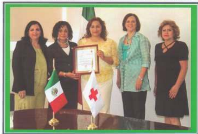
Cultura de la Legalidad