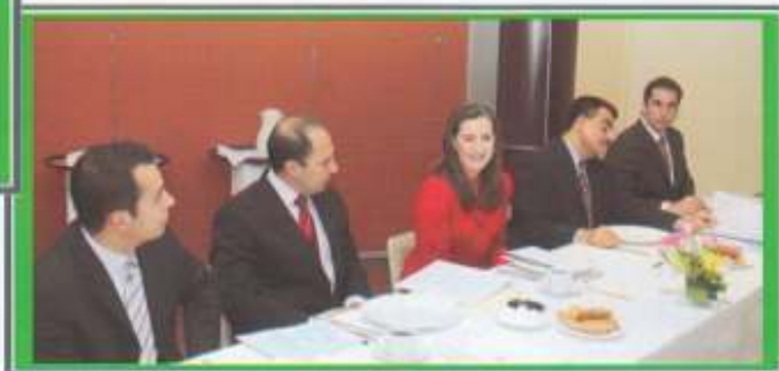
Firma de Convenio para el funcionamiento del Centro Municipal de Mediación y Conciliación en Puebla capital.