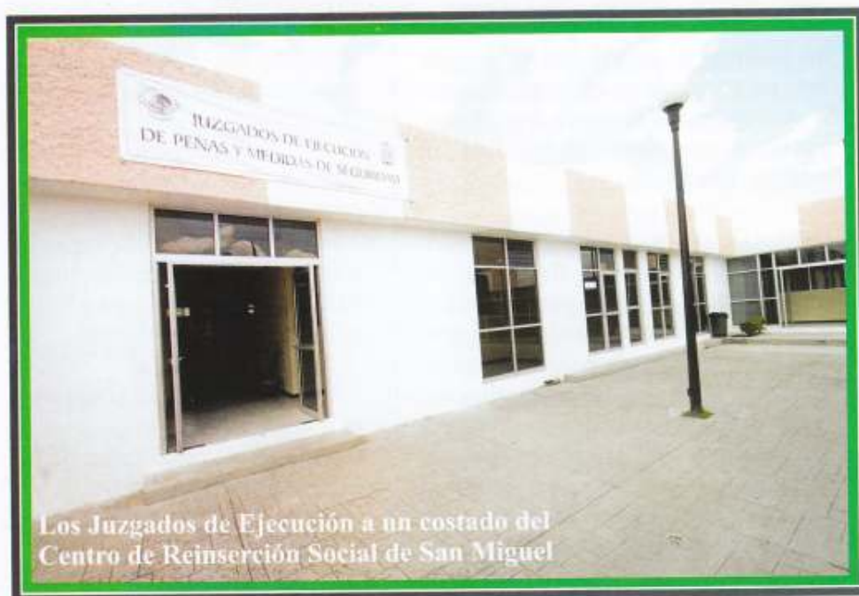
Los Juzgados de Ejecución a un costado del Centro de Reinserción Social de San Miguel

La función primordial de los jueces, en el nuevo sistema penal, es la de judicializar el procedimiento para que las personas condenadas por sentencia irrevocable, den cumplimiento a las sanciones y medidas de seguridad impuestas por los Jueces Penales, por ende, son la autoridad competente para determinar la duración,